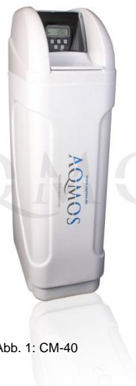
Abb. 1: CM-40