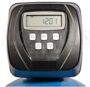
Abb. 2: Steuerventil Clack WS 1 CI

GFK- Druckflasche, gefüllt mit hochwertigem Ionenaustauscherharz, Kabinettgehäuse für einen Salzvorrat von max. 70kg, mengengesteuertes Zentralsteuerventil Typ Clack WS 1 CI, integriertes Feinverschneidungsventil, Absaugeinrichtung und Verbindungsleitung zum Zentralsteuerventil.