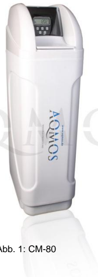
Abb. 1: CM-80